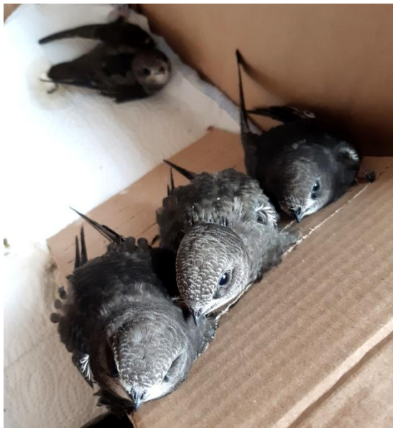
Junge Mauersegler von 2020