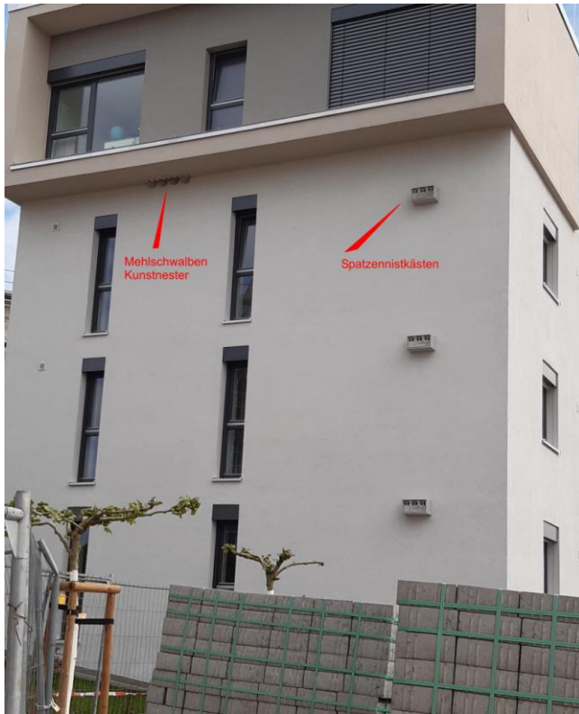
Thomas Jefferson Str. 76 - 4 Kunstnester sowie Nistkästen für Spatzen