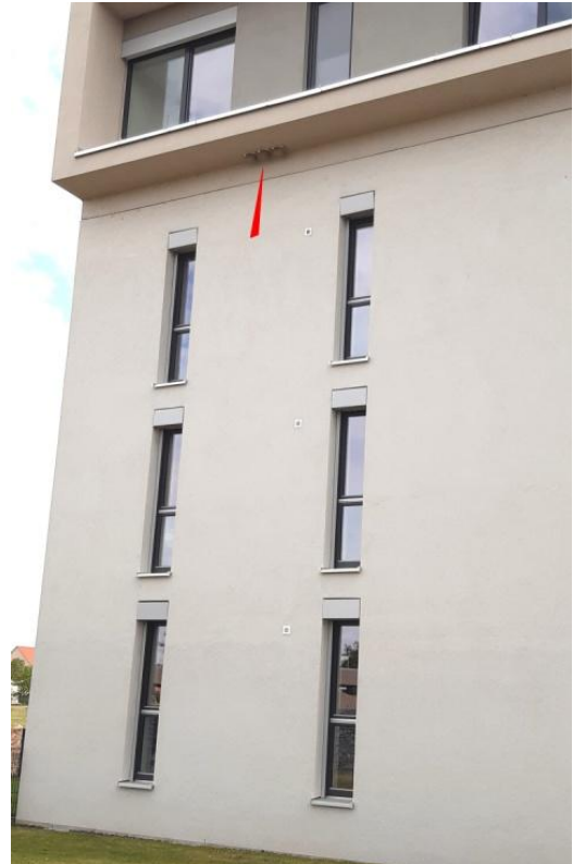
Abraham Lincoln Allee 16 – 3 Kunstnester